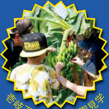
壱岐王様バナナ農園見学