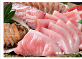
▲ 刺し盛り 天候・海況により仕入れが変わりますのでご了承ください。