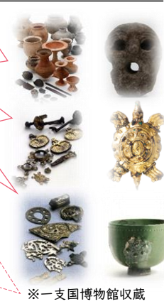
※一支国博物館収蔵

<原の辻遺跡出土品> 中国大陸や朝鮮半島の国々との交流や交易を物語る貴重な宝。1000点以上が国の収容文化財。(女性) <笹塚古墳出土品> 金銅製の馬具や新羅で製作された土器が出土し、朝鮮半島の国々につながっていたことを知ることができる。 <双六古墳出土品> 日本最古の二彩陶器が出土。他にも約400点出土。朝鮮半島の国々に精通した有力者のお墓では?とロマンがある。 <一支国博物館> ・宍岐の歴史を約2000点の資料で紹介。故・黒川紀章設計の博物館。 ・表情豊かなジオラマや体験展示で宍岐の歴史を楽しく学べる博物館。 ・お子様も楽しんでいただける仕掛けがいっぱいの、遊んで学べる施設です。